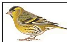
Tarin des aulnes