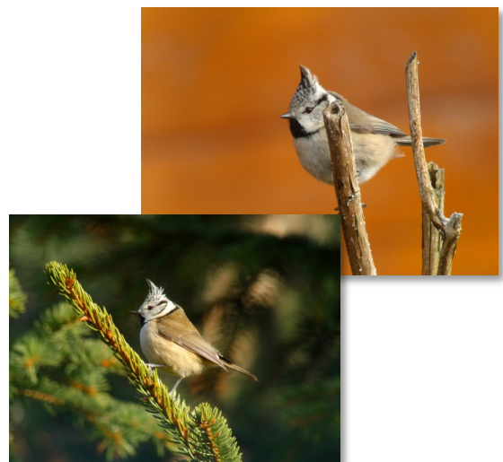
Mâle ou femelle