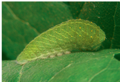
Chenille du Flambé