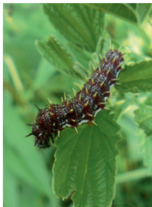
Chenille du Vulcain

Grand papillon au vol puissant, le Vulcain peut migrer à la bonne saison jusqu'aux limites du cercle polaire. Il a aussi réussi à se glisser dans les bagages des hommes et a suivi les voyageurs aux Antilles, en Amérique du Nord et même en Nouvelle-Zélande. Cette performance est peut-être due à son habitude de chercher un abri dès les premiers froids. En effet, la dernière génération annuelle de ce papillon passe l'hiver sous forme adulte, habituellement dans les buissons de lierre, mais aussi dans les granges et les greniers. En hiver, la chenille construit un hibernaculum, un abri pour passer la mauvaise saison, à l'aide de feuilles ramollies «cousues» par un fil de soie. À l'automne, l'adulte se régale de fruits tombés au sol ou de la sève des arbres.